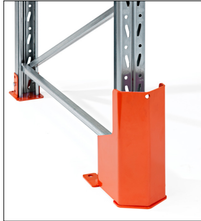
Pylväänsuoja 400 mm PU-jousella - asennetaan betonilattiaan. Parantaa suojan törmäskestävyyttä.