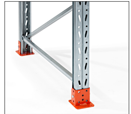
Suoja-aluslevy - suojaa pylvään alinta osaa ja samalla kunnan kiinnitys lattiaan.