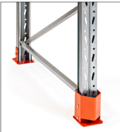
Pylväänvahvike 90 - yhdessä suoja-aluslevyn kanssa. Estää pylvään vaurioitumista ja vie vähän tilaa. Korkeus 150 mm.